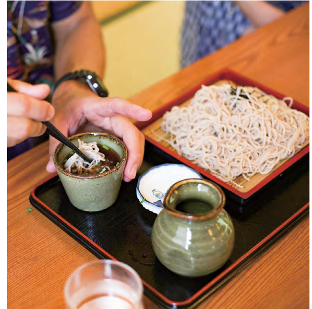
ならこ名物 葛そば

張り切り過ぎなくてもいい。 山小屋のおかさんが 作ってくれた蕎麦が美味しい。 それ目当てに来たって言ったら 笑われるかな。