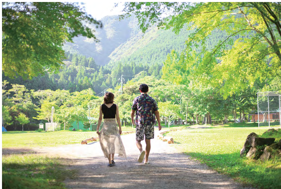
テントサイトまで歩く、寄り道してもいい、川を見に行ってもいい。