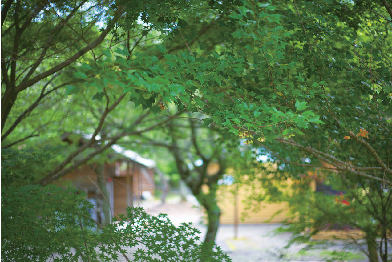
ならこの里キャンプ場 バンガロー