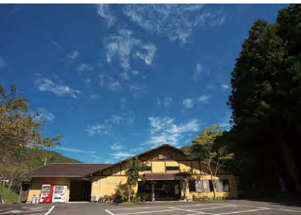
ならこの里キャンプ場 受付・管理棟