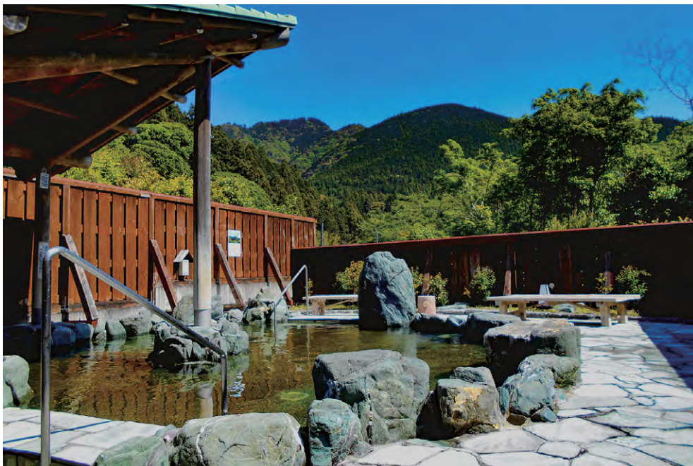
天然温泉 ならこの湯